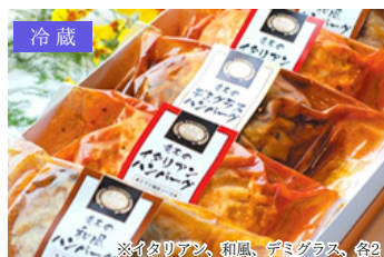
冷蔵 HS-42 米沢牛黄木 米沢牛入ハンバーグセット 150g×6／4,536円 (税込)