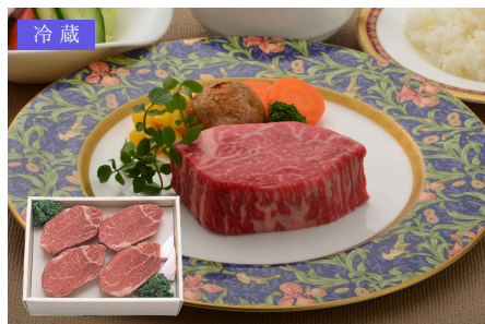
冷蔵 OA-03 米沢牛黄木 米沢牛フィレステーキ 130g×4枚／17,280円 (税込)