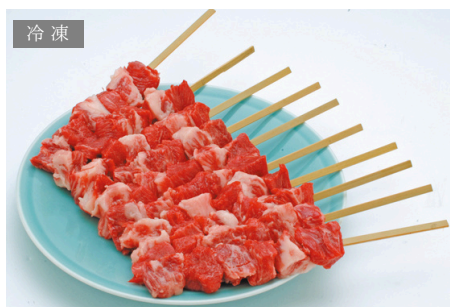
登起波 TC-45 米沢牛串焼き10本セット 50g×10本／5,850円 税別