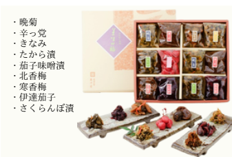
MAY-33 三奥屋 風趣彩「彩あつめ」 漬物9種詰合せ／3,780円 (税込)