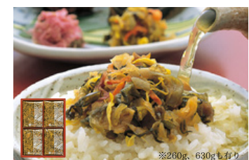
MB-62 三奥屋 晩菊詰め合せ 480g／2,700円 (税込)