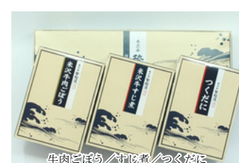
TC-09 登起波 米沢牛惣菜詰合せ 3種／3,350円 (税込)