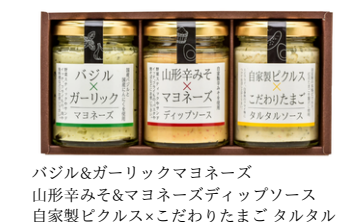
MSD-25 後藤屋 ディップソースセット 90g×3／2,706円 (税込)