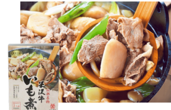
OAI-2 米沢牛黄木 米沢牛いも煮2人前 600g／1,580円 (税込)