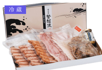
冷蔵 TC-400 登起波 ハム・ソーセージ詰合せ 6種＋マスタード付／4,428円 (税込)