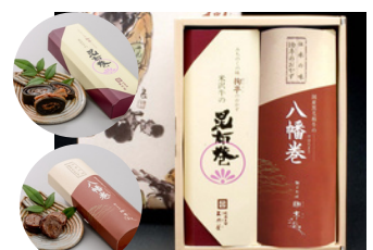
MK-25 三奥屋 米沢牛昆布巻／八幡巻 各×1本／3,405円 (税込)