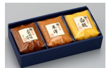
JH-04 花角味噌醸造 米沢の味噌3種詰合せ 300g×3／1,905円 (税込)