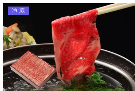
米沢牛紀伊国屋 K-06 米沢牛ロースしゃぶしゃぶ用 600g／14,688円 税別