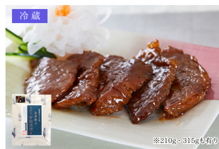
冷蔵 TC-10 登起波 米沢牛登起波漬 モモ・ロース510g／8,640円 (税込)