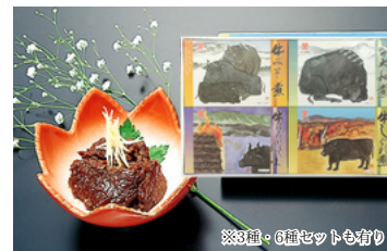
BE-33 米沢牛黄木 牛佃煮「霜ヶ香」セット 大和煮、しぐれ煮 みそ煮、にんにく風味 3,564円 (税込)