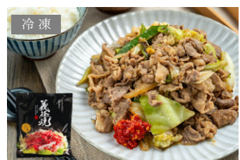
冷蔵 YY-06 羊肉のなみかた 義経焼6人前セット 2人前／3袋 4,740円 (税込)