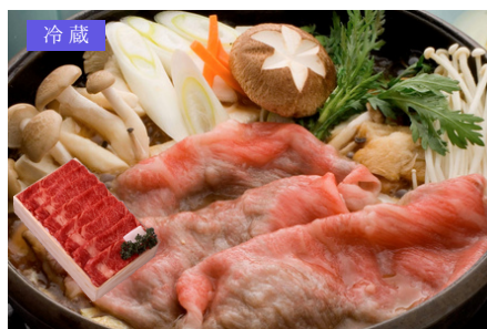
冷蔵 K-03 米澤紀伊国屋 米沢牛ロースすき焼き用 400g／9,936円 (税込)