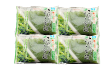
NO-6 いの食品 こんにゃくうこぎ麺 120g×6／1,157円 (税込) ※たれ付き