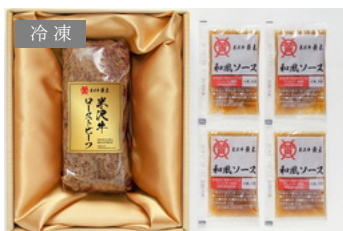
冷蔵 OA-100 米沢牛黄木 米沢牛ローストビーフ 300g／ソース付 10,800円 (税込)