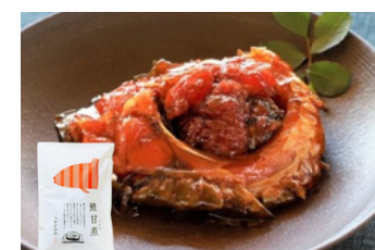
A-4 みやさかや 鯉の甘煮4切入り 170g×4袋／4,130円 (税込)