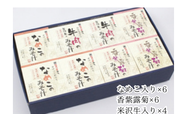
JH-08 花角味噌醸造 フリーズドライ味噌汁 16個入／3,386円 (税込)