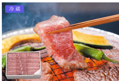
米沢牛黄木 OA-13 米沢牛焼肉用カルビ (肩三角) 500g／11,340円 税別