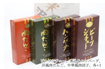
TT-32 米沢牛黄木 厨房料理詰合せ 4種／4,002円 (税込)